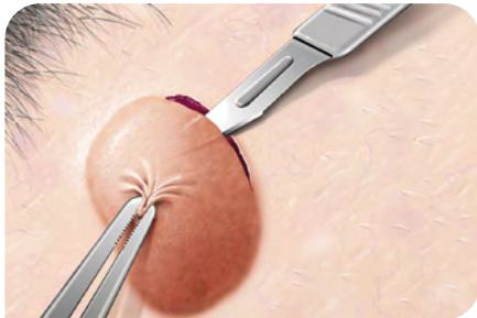
Abb. 1: kalte Exzision