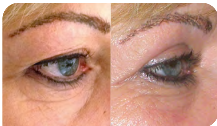
Abb. 5: Vor und nach einer Oberlidplastik

Haftungsausschluss: Unsere Leitfäden werden in Zusammenarbeit mit führenden Medizinern des jeweiligen Fachgebietes erarbeitet. Sie stellen keine detaillierte Therapieanleitung dar. Sie ersetzen auch nicht die Gebrauchsanweisung der eingesetzten Medizinprodukte. Jegliche Haftung für das Behandlungsergebnis wird, soweit sie über die gesetzliche Herstellerhaftung hinausgeht, ausgeschlossen.