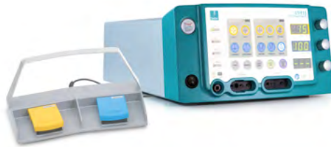
CURIS® 4 MHz Radiofrequenz-Generator Basis-Ausstattung