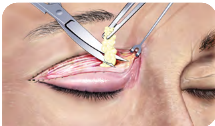
Abb. 4: Entfernung von prolabierendem Fett nach Eröffnen des Septum orbitale