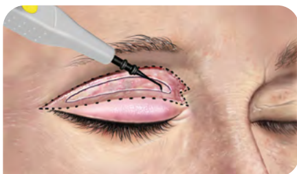
Abb. 3: Exzision eines schmalen Streifens M. orbicularis oculi