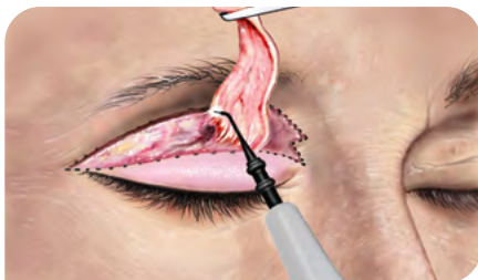
Abb. 2: Hautschnitt und Exzision des Hautareals mit Mikrodissektions-Elektrode