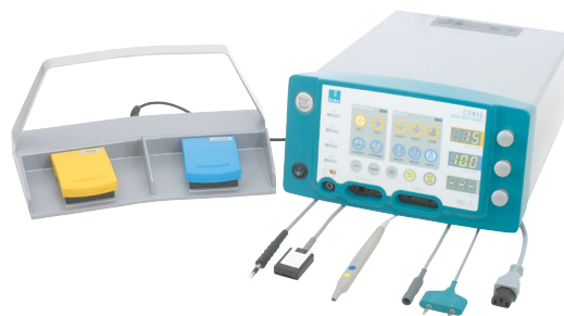
[réf. 87 00 10] CURIS® générateur de radiofréquence 4 MHz

Set de base avec électrodes neutres à usage unique