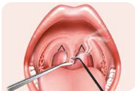
Abb. 4: Resektion überschüssiger Uvulaschleimhaut und Schnittführung für eine dreiecksförmige Exzision am hinteren Gaumenbogen