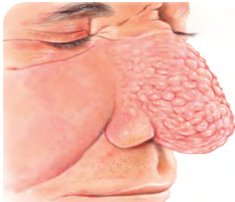
Abb. 1: Vor der Rhinophym-Resektion