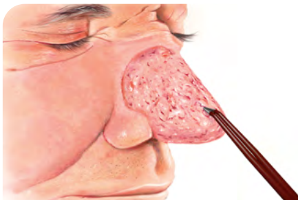
Fig. 3 : Coagulation bipolaire des parties qui saignent encore