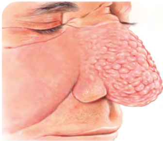
Fig. 1 : Avant la résection du rhinophyma