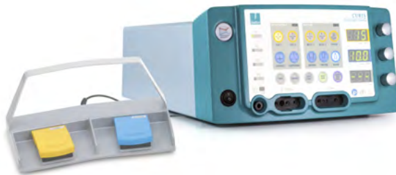
CURIS® générateur de radiofréquence 4 MHz Équipement de base