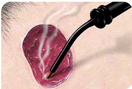
Fig. 2: Ablation tangentielle