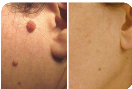
Fig. 4: Zone pré-opératoire Fig. 5: Zone post-opératoire