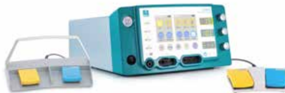
CURIS® 4 MHz Radiofrequenz-Generator Basis-Ausstattung