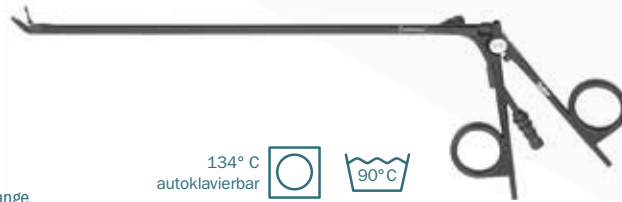
Calvian® bipolare Zange