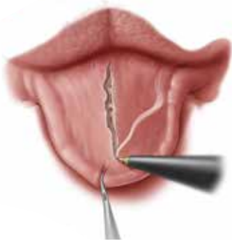
Abb. 2: Mediale Durchtrennung der glossoepiglottischen Falte mit einer geraden ARROWtip™ monopolaren Mikrodissektions-Elektrode (REF: 36 44 71).