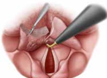
Abb. 3: Horizontale laterale Schnittführung mit einer 90° gewinkelten ARROWtip™ monopolaren Mikrodissektions-Elektrode (REF: 36 44 73).