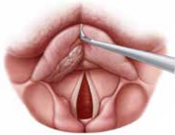
Abb. 1: Supraglottische Karzinome.