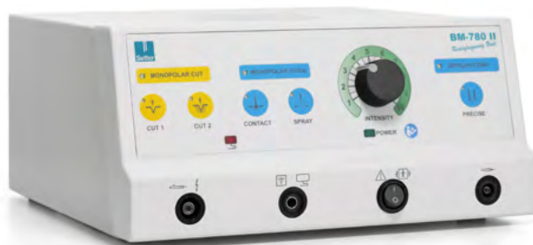
BM-780 II Générateur de radiofréquence Équipement de base