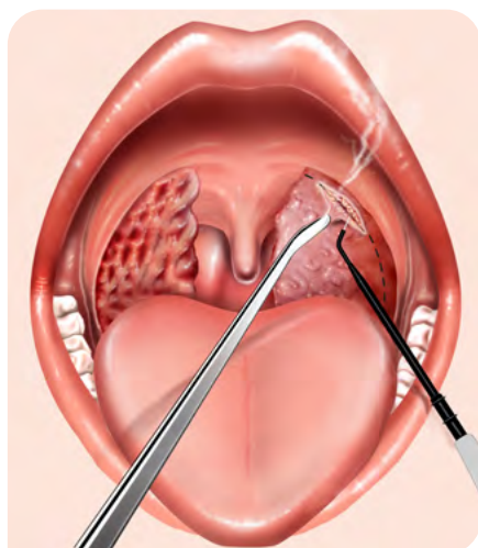
Fig. 2: La partie saillante de l'amygdale est séparée le long de la ligne d'incision, parallèlement au pilier antérieur du voile du palais. L'amygdale est saisie ici sans traction ou seulement avec une légère traction.