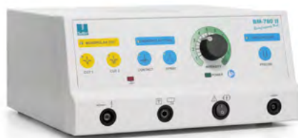
BM-780 II Radiofrequenz-Generator Basisset