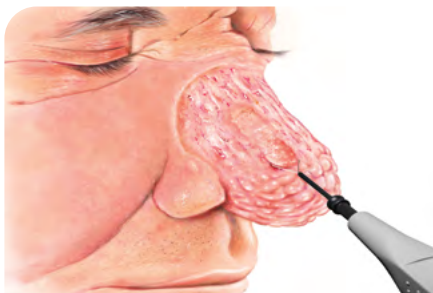
Abb. 2: Während der Rhinophym-Resektion